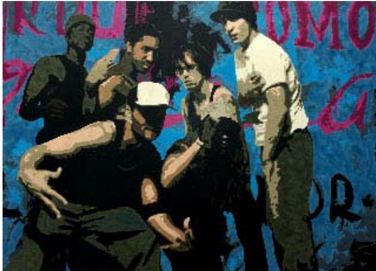
Wesh-Wesh Acrylique sur toile 100X139 cm 2007

Venu à l'art suite au choc visuel et culturel du graffiti, Antoine Gamard est resté attaché à l'univers urbain et à ses logo types qui envahissent la ville.