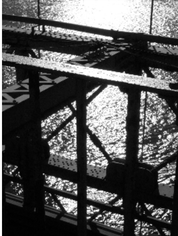
Bolting 50X66cm 2008