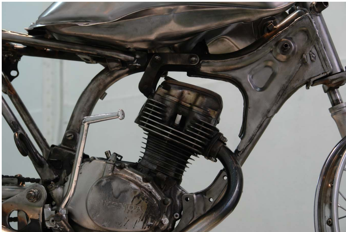
Steel Life Moto, Polissage 160 X 100 X 60 cm 2007

« Produit du vandalisme qui suivit l'élection présidentielle de mai 2007, cette sculpture est le reflet du travail accompli pour redorer les éclats d'un engin voué au silence, à l'immobilité.