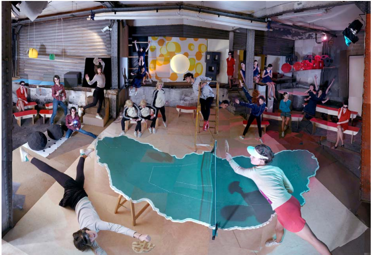
Match points Tirage Lambda Duratrans sur table lumineuse, 127x83x100 cm 1/1 2007

« Témoins actifs de notre époque et de notre société, photoreporters et plasticiens en proposent des interprétations plus ou moins réalistes. Je combine ces subjectivités en photographiant les oeuvres d'art. Je déjoue les codes de la photographie en focalisant son objectif prétendument réaliste sur une représentation abstraite.