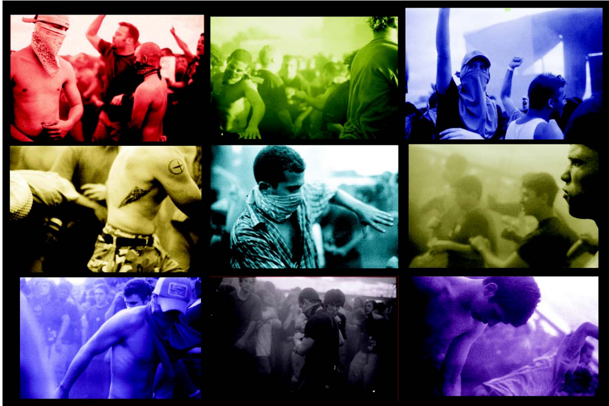
Rebellion from tyranny 9 photographies 2008